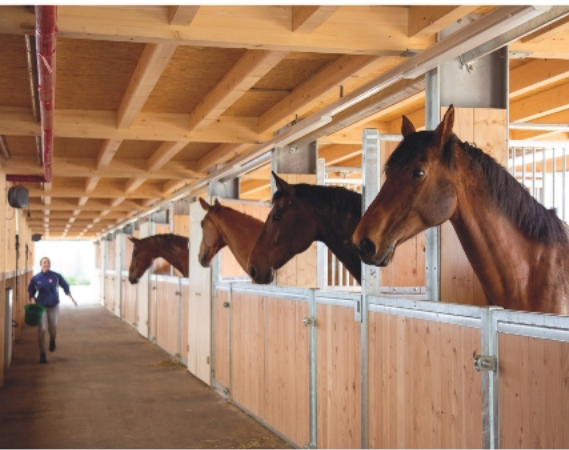
Montmirail | Agriculture et chevaux

Nous apprécions la halle lumineuse à chacun de nos entraînements ou autres activités. Les chevaux eux aussi se sentent bien dans leur box avec terrasse et vue sur les Alpes.